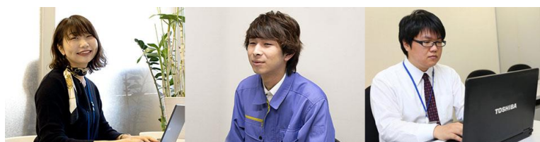
わたしたちがプログラミングするものはお客様の未来です。 わたしたちはお客様の豊かな未来を創造するという使命感を持った同志集団です